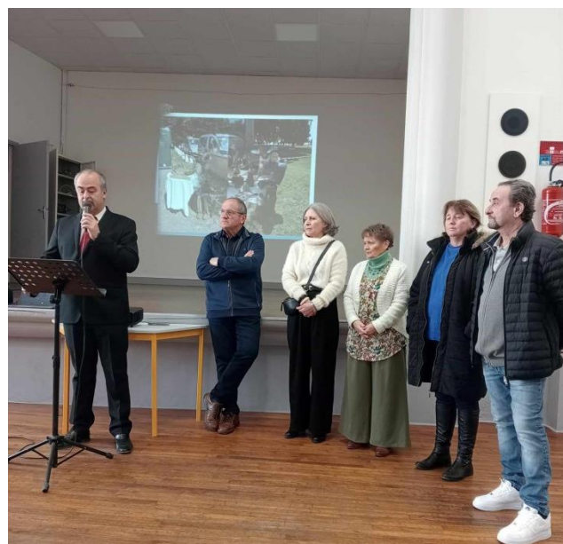
Le discours du maire

Un buffet préparé par l'équipe municipale a permis à l'assemblée de partager les nourritures terrestres et d'échanger de façon informelle et conviviale.