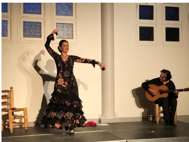
Tal Y Cual – 7 août 2021 Ambiance chaleureuse à la soirée flamenco et tapas proposée par la mairie.