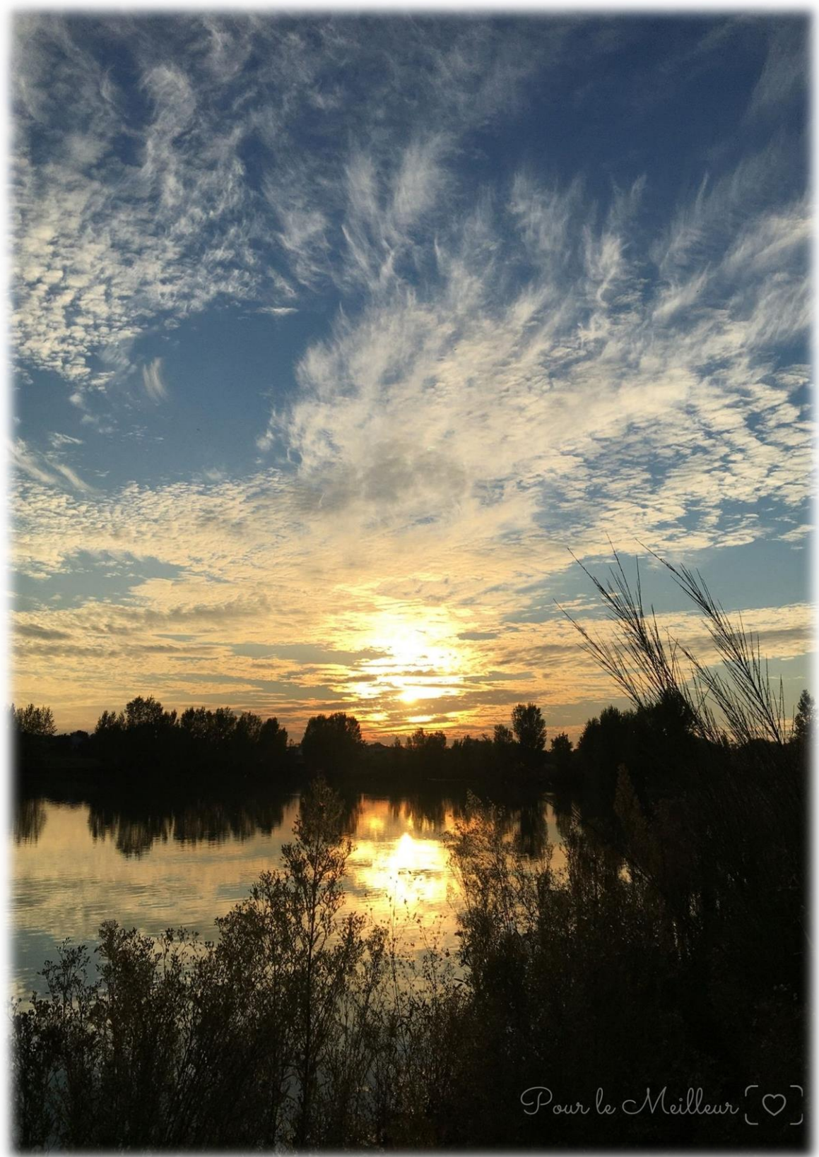
Promenade autour du lac Contribution photographique d'Emilie GUILLAUMONT, habitante de Saint-Aignan