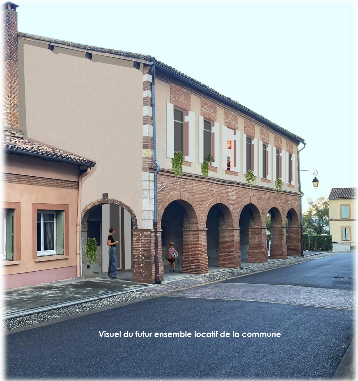
Visuel du futur ensemble locatif de la commune