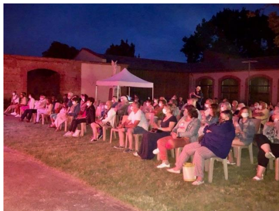
La Bedoune – 23 juillet 2021 Concert organisé par Moments de Cultures vivantes (MCV)