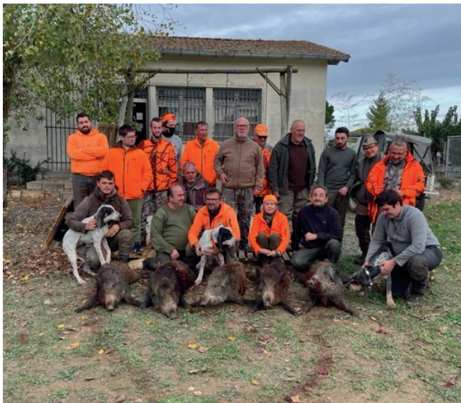
*chasseurs en occitan

Prenez soin de vous ! Les cassayres* vous souhaitent d'excellentes fêtes de fin d'année et une très bonne année 2023 Bien à vous en Saint Hubert